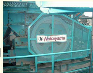
ジョークラッシャー③ AC4219