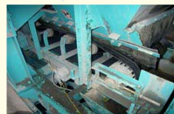
インナーコンベヤ⑧