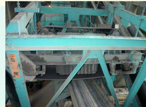
永磁的除鉄機④ SPM-80D B-1コンベヤ ⑨